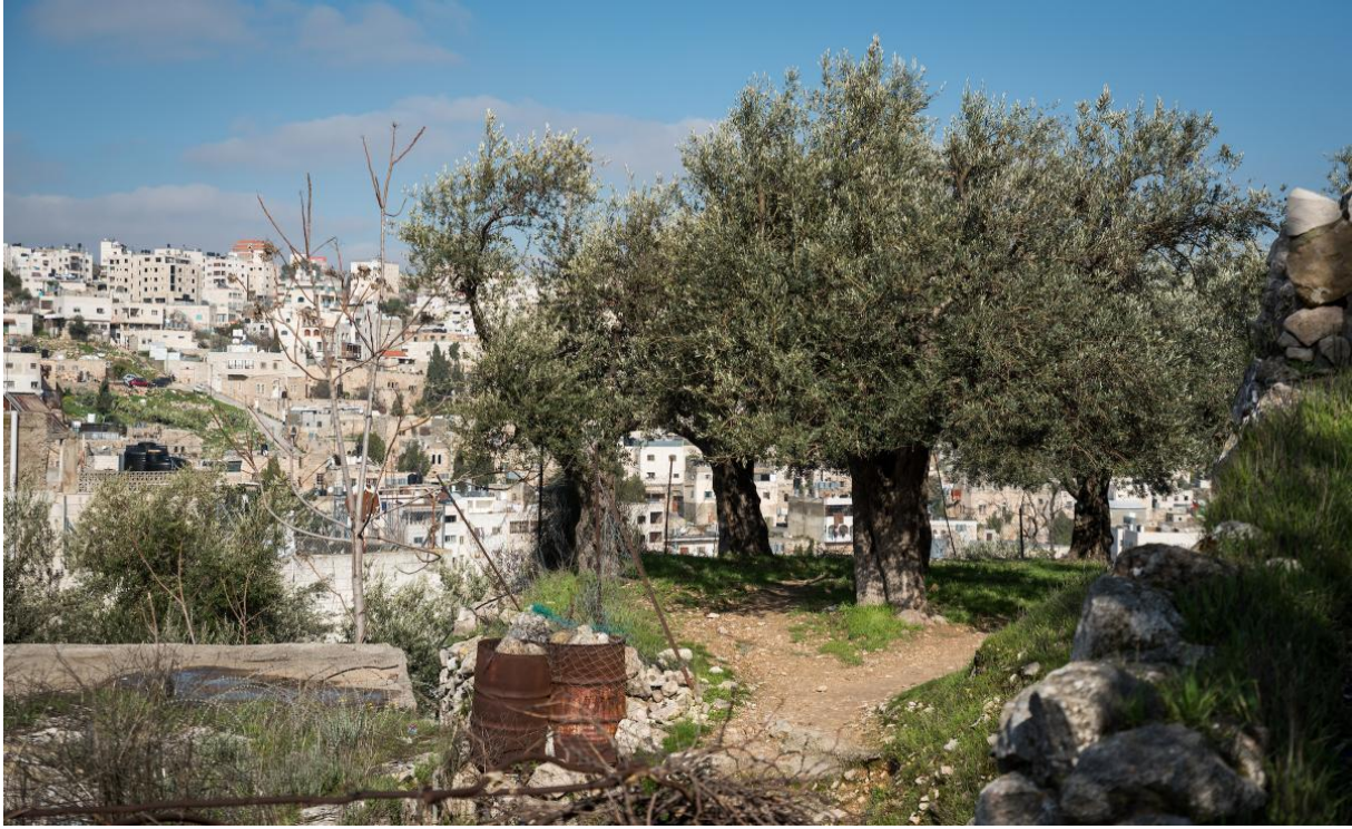
Olijfbomen groeien op een perceel in het Tel Rumeida gebied van Hebron, West Bank, maart 2020.

Foto credit: Albin Hillert/WCC als onderdeel van het EAPPI programma