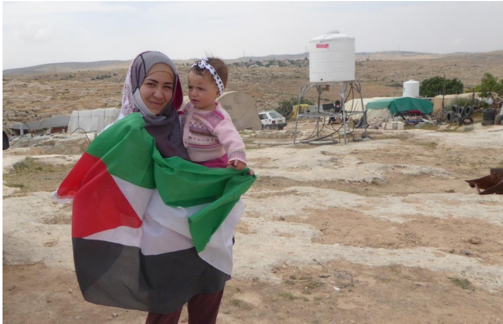
13/05/15. Zuidelijke Hebron Heuvels. Bewoners proberen de moed erin te houden ondanks de vrees voor uitzetting in het dorp Susiya

Gebied C op de West Bank is de thuisbasis van ongeveer 300.000 Palestijnen die leven onder het volledige gezag van Israël en zijn militaire regime. Gebied C wordt vaak over het hoofd gezien op het internationale platform, misschien omdat de uitdagingen en onrechtvaardigheden dezelfde zijn gebleven sinds 1967: uitbreiding van nederzettingen, geweld van kolonisten, vernielingen en meer. Veel van de lezers hier zullen zich Israëls recente mislukte poging herinneren om de Jordaanvallei en het grootste deel van Gebied C te annexeren. De afgelopen twee jaar onder de nieuwe realiteit van COVID-19 zijn echter anders geweest door het gebrek aan internationale beschermende aanwezigheid.