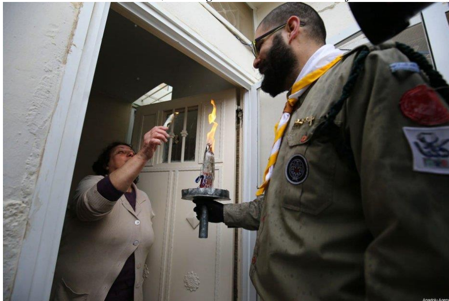
Jeruzalem, de weg naar vrede wereldwijd